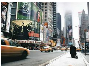
Zlatko Kopljar: Times Square

Als je deze foto bekijkt dan dringt de vraag zich op of wij als moderne mensen niet veel te druk zijn met het najagen van dingen die ons ons als heilig, als belangrijk, als waardevol worden gepresenteerd, terwijl ze eigenlijk leeg en waarde/loos zijn.