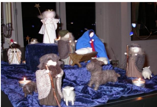
Workshop Kerstfiguren maken