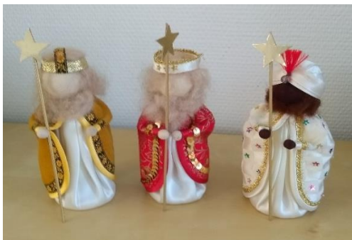
Drie Koningen Workshop Kerstfiguren maken, 19 december